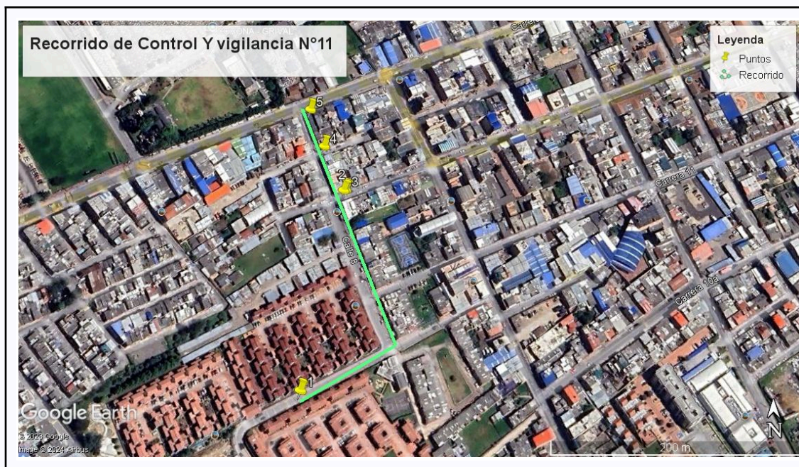
Ilustración 1. Recorrido de Control Y Vigilancia N°11

Con base en lo anterior, el día 9 de Septiembre del 2024 se realizó recorrido de control y vigilancia en el barrio el Prado, cuadrante 3 desde las coordenadas 4°42'43.938"N- 74°12'57.606"W hasta las coordenadas 4°42'51.876"N- 74°12'57.516"W (ver ilustración 1. Ruta verde)